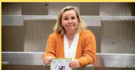
Liesbeth Homans, Vlaams Parlementsvoorzitter