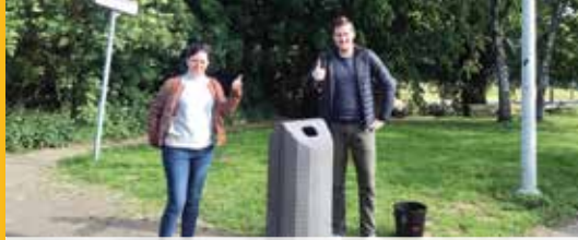
Een terug- en vooruitblik van onze districtsraadsleden (p.2)