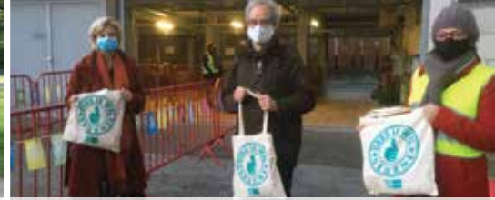
Deurne zorgt voor warmte, licht en verbondenheid (p.5)